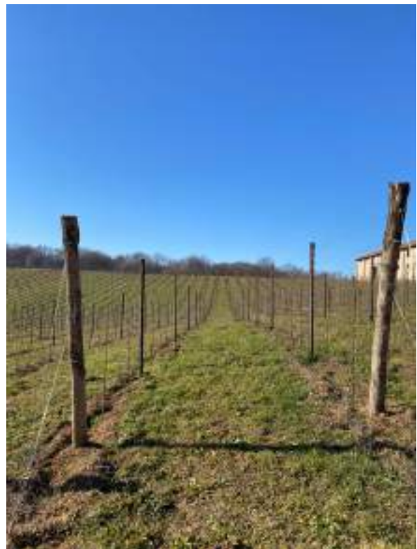
Particolare delle due aree oggetto di intervento nel 2021 ( a destra ) e nel 2022 ( a sinistra )