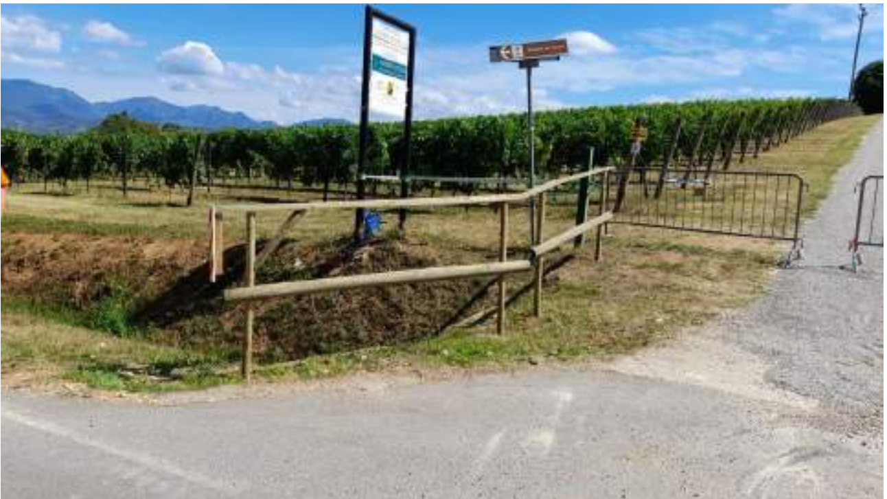
Particolare della staccionata posizionata all'ingresso principale da Via Porcù