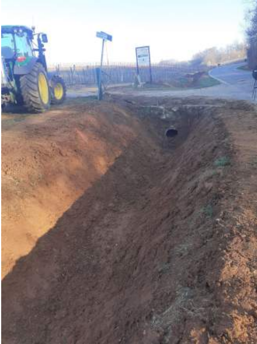
Particola della pulizia del ponte e di rettifica/pulizia del fosso in via Porcù