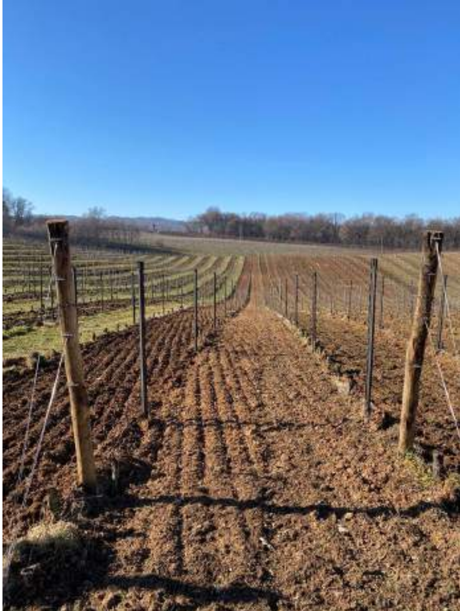
Particola della zona attualmente in fase di estirpo