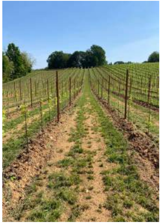
A Sinistra primavera 2021 durante l'aratura del lotto dove è stata sostituita la vecchia struttura A Destra lo stesso lotto nella primavera 2022