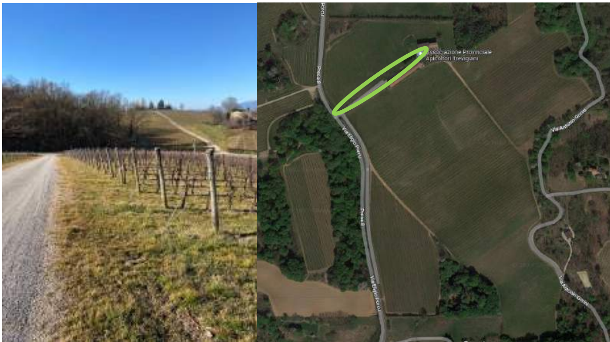
Particolare della testata oggetto di ripristino