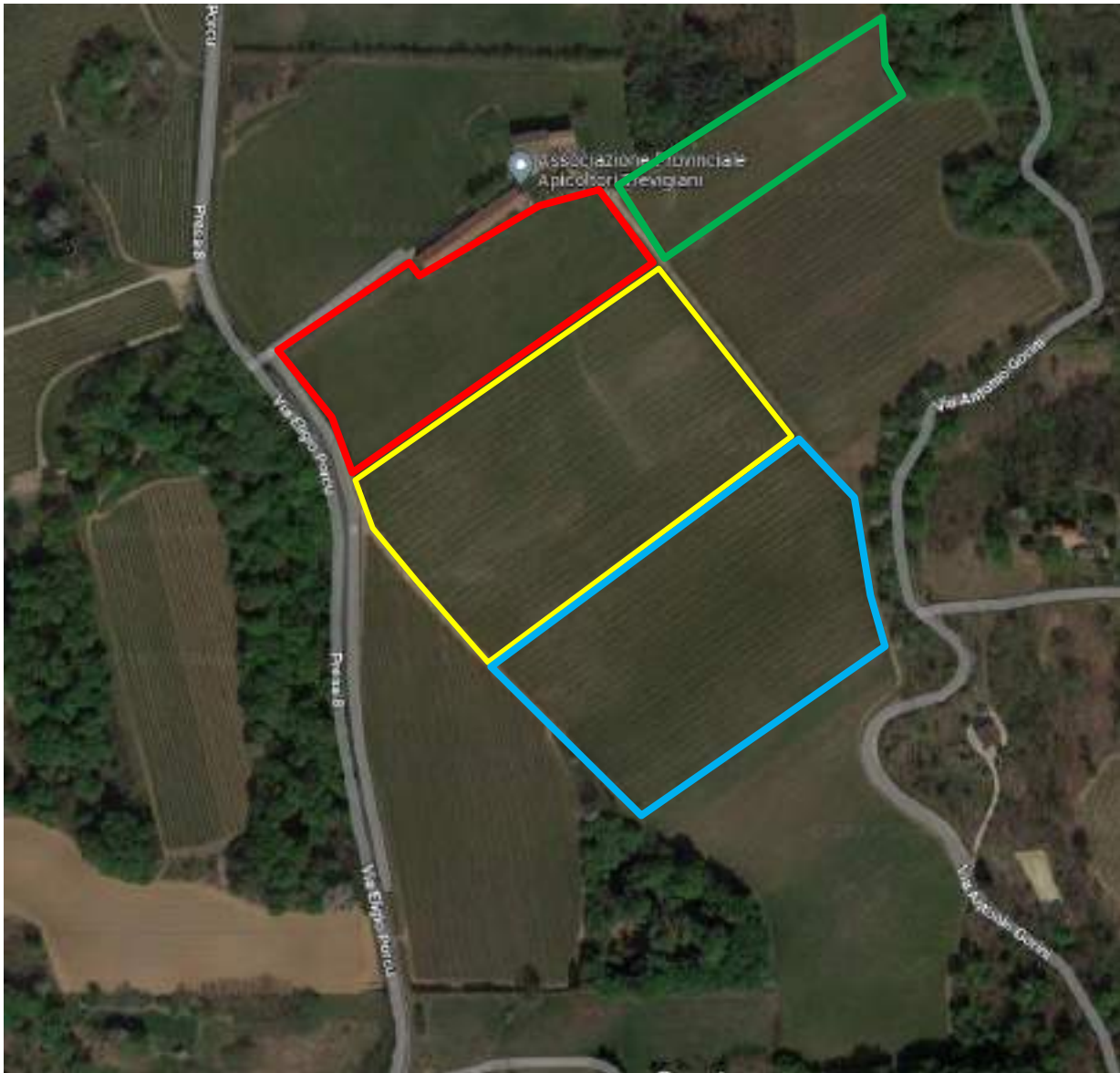
Mapa con individuate le zone oggetto di estirpo e reimpianto