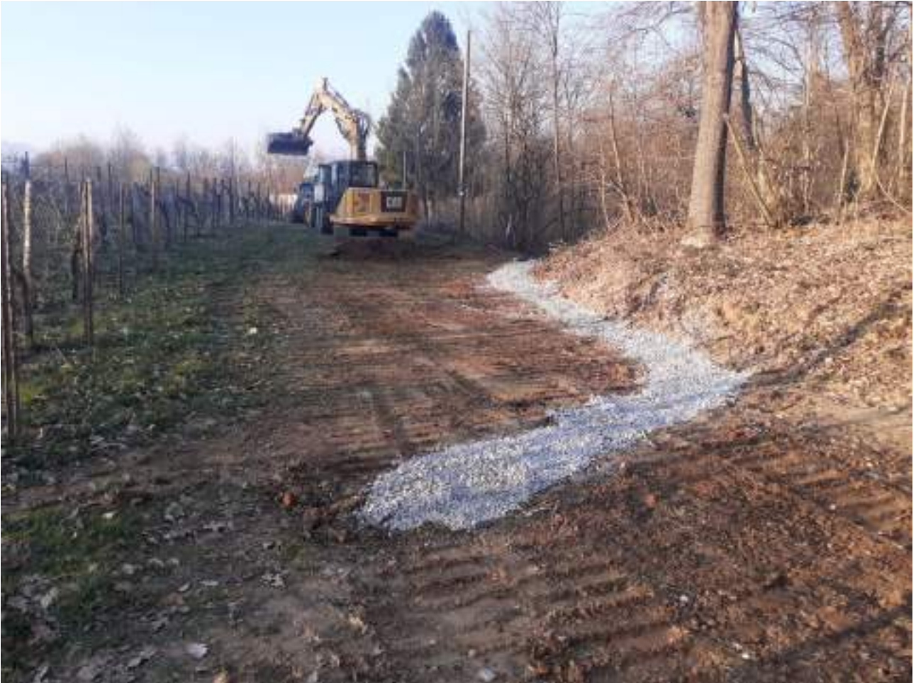
Particola del drenaggio posato nella zona di ristagno